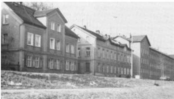
Abb. 8 Straßenansicht des Wohnkomplexes Schweinfurter Straße 39 - 53 (1883/84).

Da die Stadtgrenze entlang des Zollhauses verlief, gab es am Ende der Jahrhundertwende keinerlei Werkwohnungen auf Bamberger Grund und Boden. Man entschloss sich, ab dem Zollhaus entlang der Schweinfurter Straße stadteinwärts einige Parzellen des nur sehr schmalen und ebenerdigen Geländes an der Straße und einige Grundstücke am Abtsberg anzukaufen. Man baute daher im Jahre 1883 einen großen Wohnblock mit zwei Stockwerken, etwa 39 Wohnungen, den „Stadtbau“.