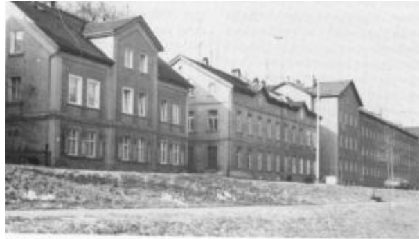
Abb. 8 Straßenansicht des Wohnkomplexes Schweinfurter Straße 39 - 53 (1883/84).

Die drei Wohnhäuser, wieder in gleicher Bauweise erstellt, waren der Abschluss des Ochsenangers und der Grundbesitz der ERBA in nordwestlicher Richtung in Gaustadt. Über die Schwarze Brücke kam man auf die Erba-Insel, die vor dem Bau des Main-Donau-Kanals eine große Flächenausdehnung besaß, mit einer Vielzahl von Kleingärten und Feldern, die die Gaustadter Bauern von der ERBA in Pacht genommen hatten.