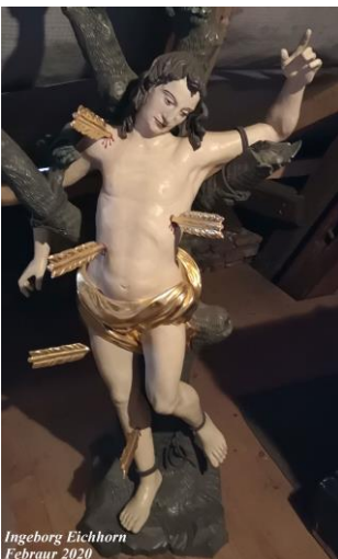
Ingeborg Eichhorn Februar 2020

Resümee: Das 1684 angefertigte Bildnis stand praktischerweise in der Spitalkirche (da musste es nicht den weiten Weg von Gaustadt nach Bamberg getragen werden). Nach der Säkularisation und Umwidmung der Spitalkirche für profane Zwecke wird es in der Oberen Pfarre untergebracht worden sein. Mit dem Ausscheiden aus dem Pfarrverband Ende 1805 dürfte es vermutlich eine Diskussion über einen weiteren Verbleib der Figur in der alten Pfarrkirche oder an einem anderen Ort gegeben haben. Schließlich wurde sie nach Gaustadt „heimgeholt“, wo sie in der 1808 gebauten Kapelle (die als Filialkirche der Pfarrei Bischberg diente) untergebracht wurde. 1906 zog sie in die neue Kirche um.