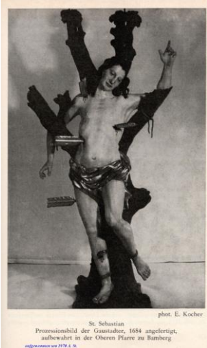
St. Sebastian Prozessionsbild der Gaustadter, 1684 angefertigt, aufbewahrt in der Oberen Pfarre zu Bamberg phot. E. Kocher

Bestärkt werde ich in meiner Ansicht durch die Bildunterschrift „1684 angefertigt“ auf dem linken Bild und eine Stelle bei Martinet (S. 63), welche lautet: „Auch ließ in diesem Jahre